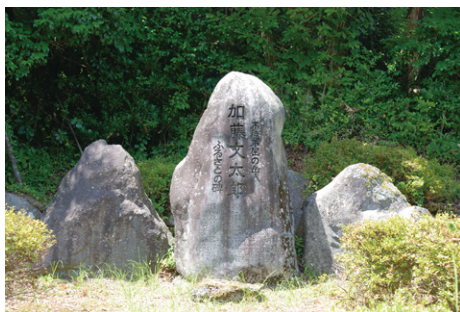
加藤文太郎ふるさとの碑