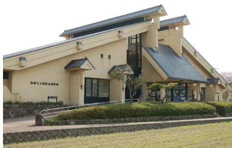
加藤文太郎記念図書館

その生涯は新田次郎の名作「孤高の人」となって出版され、多くの人に感動を与えている。町内には遺品や資料展示コーナーもある加藤文太郎記念図書館もある。